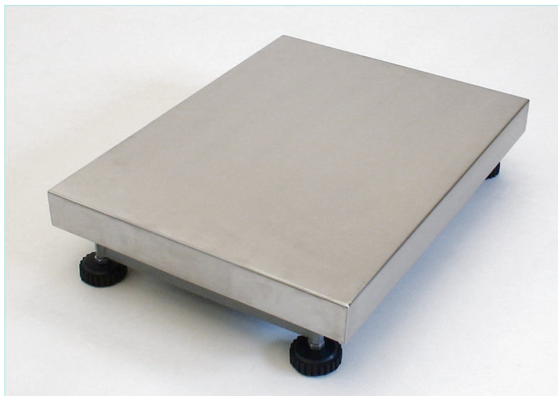
Bilden visar Modell B storlek 450 x 600

Modell A/B är en robust industrivåg för vägningsoråde 0 – 5kg, 0 – 15kg, 0 – 30kg, 0 – 60kg, 0 – 150kg eller 0 – 300kg. Vågen har utvecklats speciellt för att tåla tuff industri-miljö med inbyggda överlastskydd och transportsäkringar. Driftsäkerheten är därför också mycket hög. Modell A/B kan dessutom EG-verifieras.